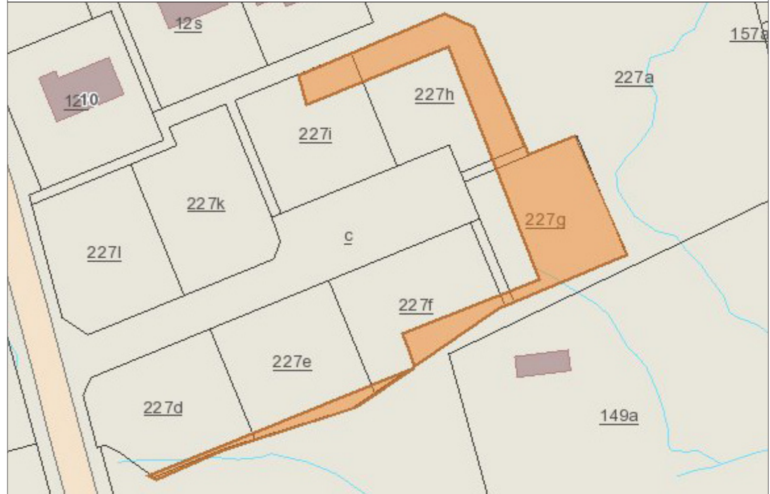
Kortið vísir einans lutirnar, sum uppskot er um at broyta