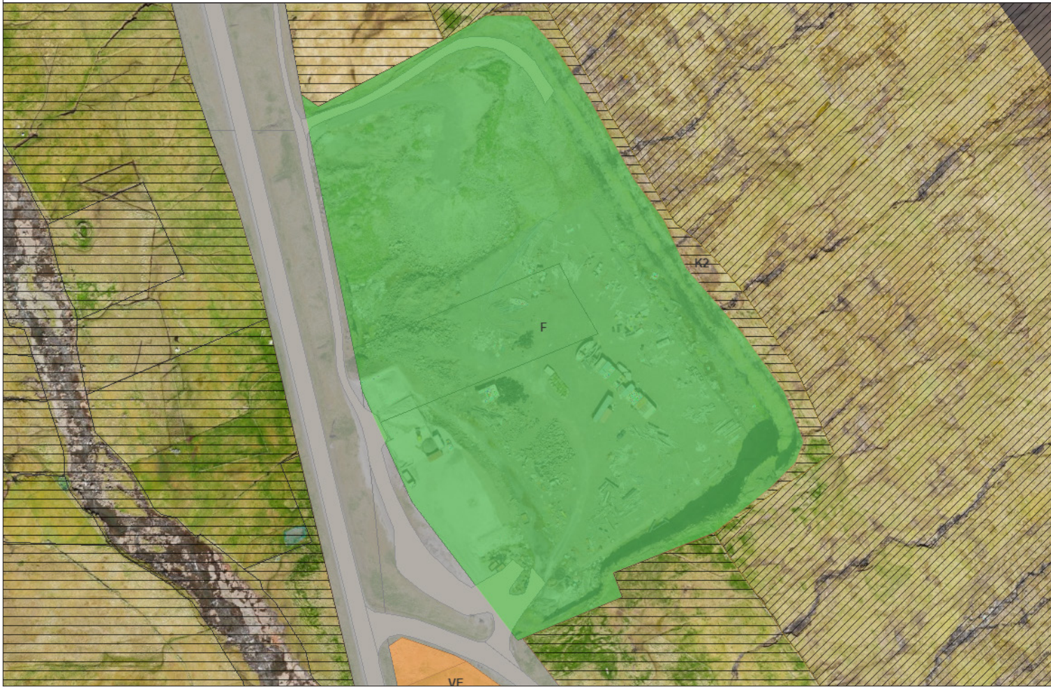
Kortið vísir verandi byggisamtykt yvir økið, har ætlanin er at gera broytingar